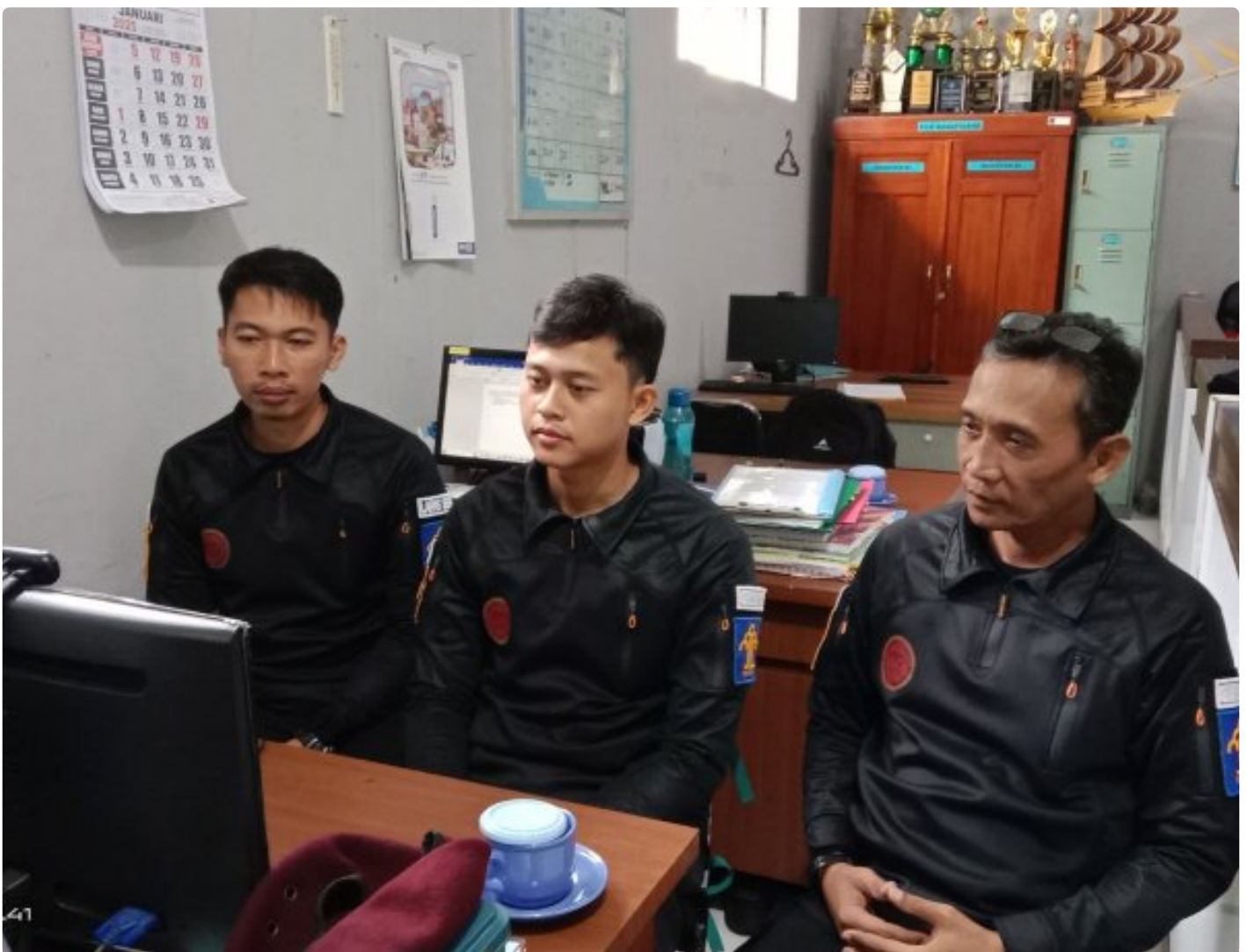
Bangun Harmoni dan Strategi, Lapas Besi Ikuti Webinar Refleksi Akhir Tahun 2024 & Resolusi 2025

CILACAP – Sebagai salah satu langkah dalam pengembangan kompetensi bagi Aparatur Sipil Negara (ASN), Petugas Lembaga Pemasyarakatan Kelas IIA Besi berpartisipasi dalam kegiatan webinar bertajuk "Refleksi Akhir Tahun 2024 dan