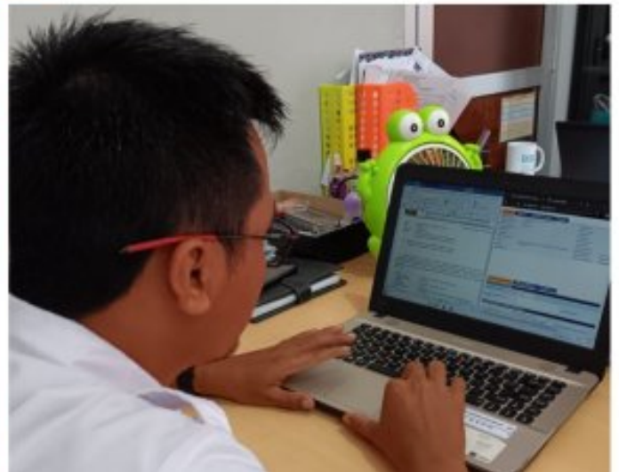
Optimalisasi Penggunaan SDP pada Balai Pemasyarakatan Kelas II Nusakambangan

Nusakambangan - SDP (Sistem Database Pemasyarakatan) adalah salah satu program unggulan berbasis teknologi informasi dari Dirjenpas (Direktorat Jenderal Pemasyarakatan) Kemenkumham RI yang berbentuk sistem mekanisme pengelolaan data warga binaan Pemasyarakatan (WBP) dan klien pemasyarakatan. SDP terus mendapatkan pembaruan untuk optimalisasi fitur-